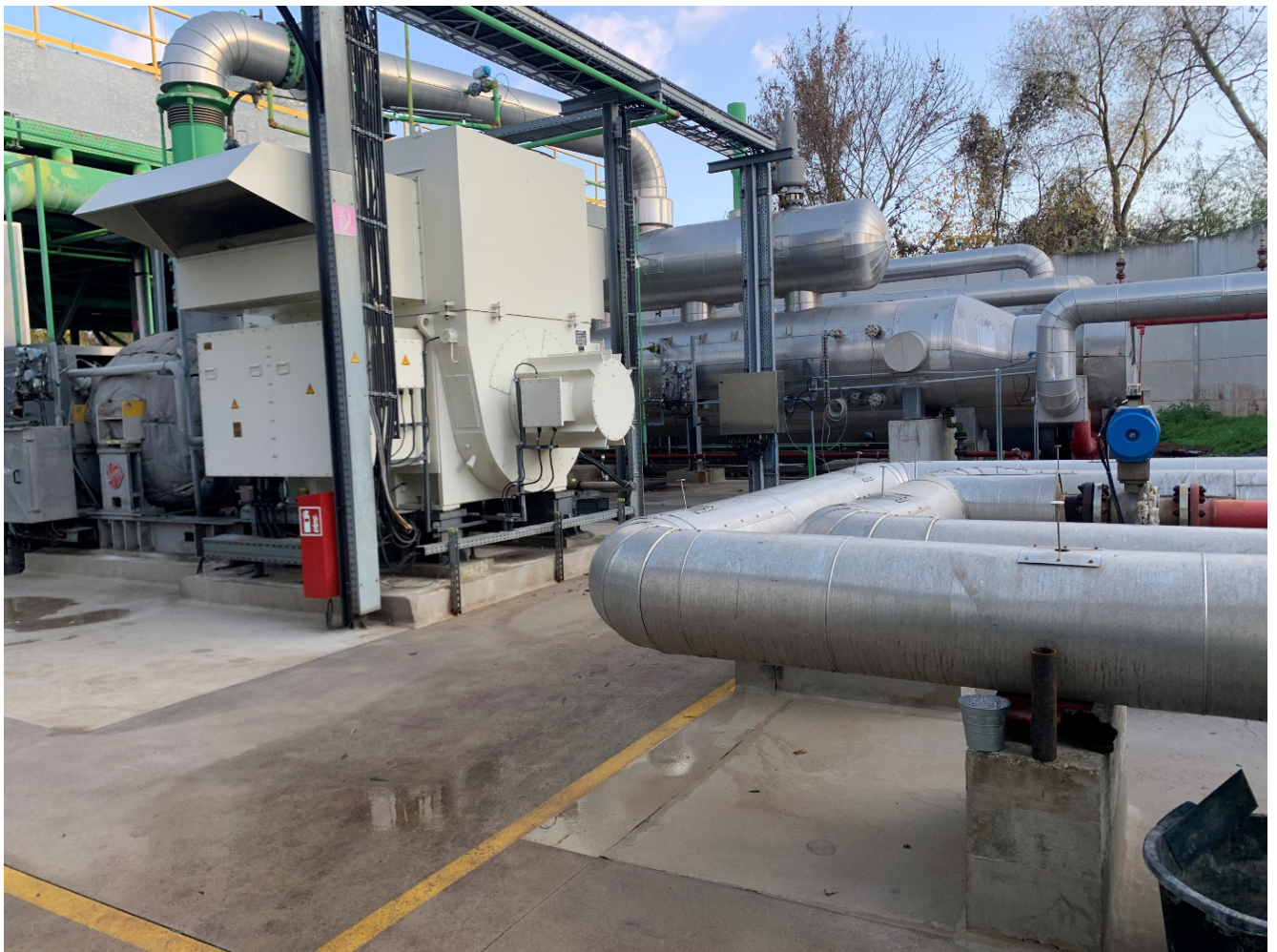
Dampfturbine mit Stromgenerator der Geothermieanlage der Fa. GEOX in Landau

Je nach Tiefenlage zwischen 2.000 m bis 7.000 m liegen hier Thermalwassertemperaturen von 80 °C bis 160 °C vor, was ein enormes Energiepotenzial birgt. Das Thermalwasser im Oberrheingraben weist zudem einen recht hohen Lithiumgehalt von durchschnittlich 180 mg/l auf.